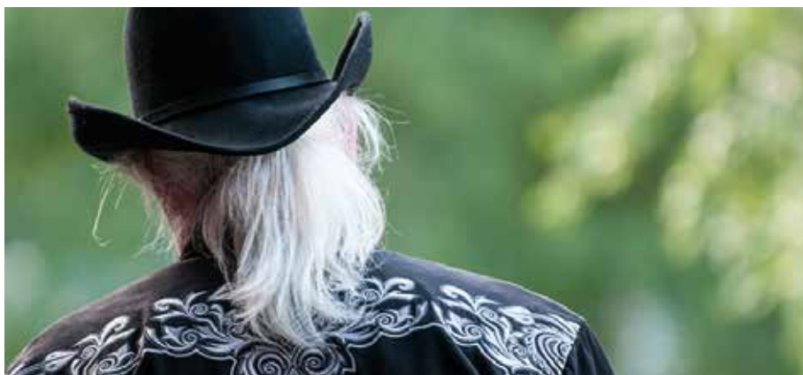
Första helgen i juli hålls den årliga Bluegrassfestivalen i Torsåker.

- Jag längtar verkligen varje år till första helgen i juli. Att på fredagen öppna portarna, känna doften av varma grillar, grönt gräs och solvarma träbänkar. Möta män-