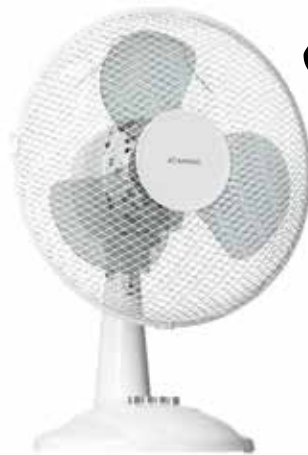
CANVAC Fläkt. CBF1303V