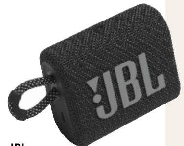
JBL Go 3. Bluetoothhögtalare