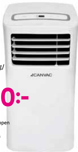
CANVAC Luftkonditionering/ CPA3802V