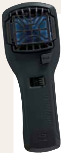
THERMACELL Myggskydd mot Myggjävlar